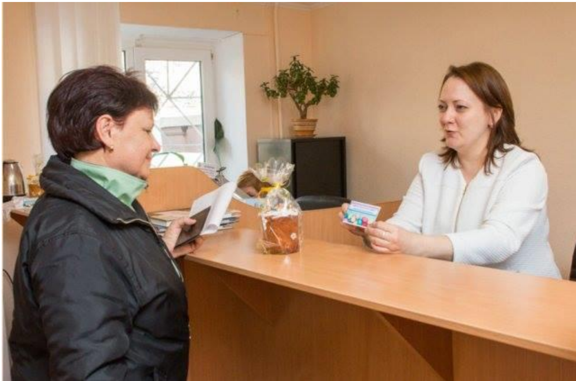
Флешмоб "ЦНАП в українській вишиванці!":